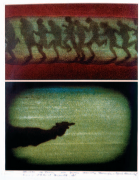
JUAN GENOVÉS 64 x 50 cm. (1970)