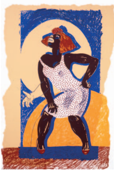
JAVIER DE JUAN 120 x 80 cm. (1997)