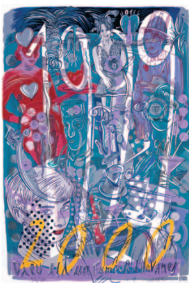
CEESEPE 120 x 80 cm. (2000)