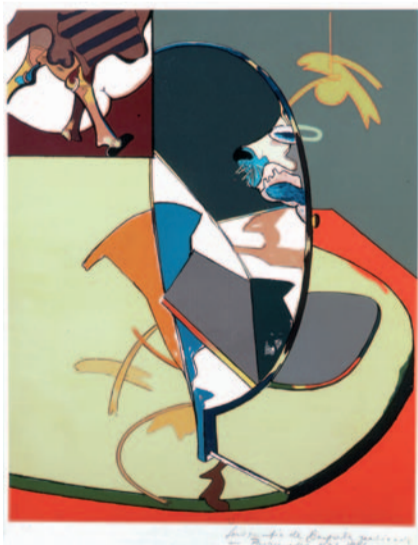
JUAN BARJOLA 65 x 52 cm. (1973)

C/ Los Molinos nº 1, 30002 Murcia 968 35 86 00 Ext. 1610 www.molinosdelrio.org