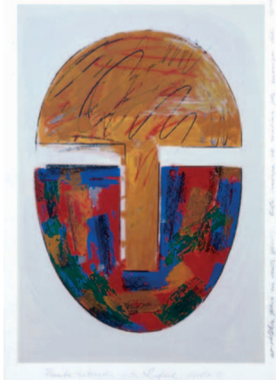
RAFAEL CANOGAR 56 x 39 cm. (1994)