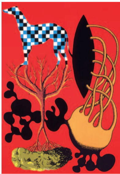
ÓSCAR SECO 90 x 63 cm. (1997)