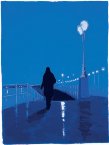
GONZALO SICRE 76 x 56 cm. (2005)