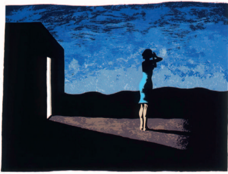
JORGE FIN 50 x 65 cm. (1999)