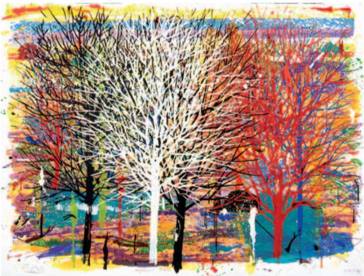
ALFONSO ALBACETE 120 x 160 cm. (2008)